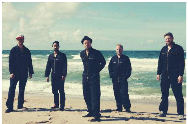
Jan Josef Liefers und Band im Sommer auf Amrum

Weitere Informationen gibt es im Amrumer Veranstaltungskalender hier .