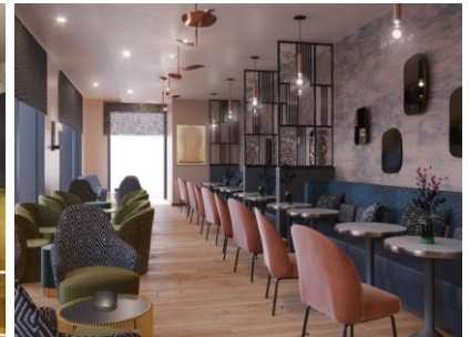
Lobby-Lounge im Leonardo Royal Nürnberg