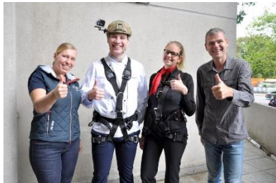
©Foto: Anne Heussner/primio PR Foto-Download per Hyperlink oder hier .