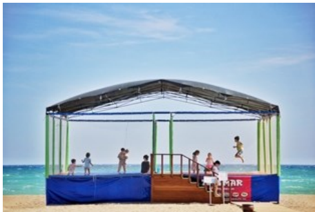
Spaß am Strand für Kids im Gloria