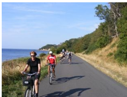
Radpause an der Müritz Traumhafte Havellandschaft