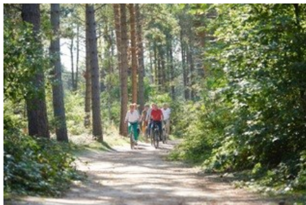
Zur Buga 2015 radeln mit der Landpartie