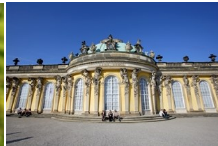
Landpartie-Buga-Tour startet in Potsdam

Foto - Download per hinterlegtem Hyperlink oder über http://www.pressedienst-radreisen.de/press_bundesgartenschau-2015-57_bilder.html