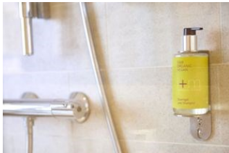
Vegan unter der Dusche