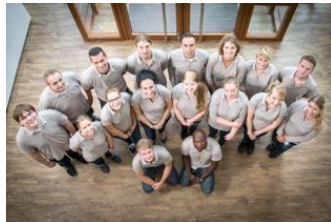
Mitarbeiter im elkline-outfit