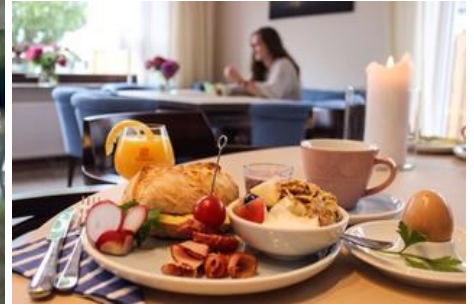
Frühstücks-Lounge als Treffpunkt

Download per hinterlegtem Hyperlink oder unter http://www.primo-pr.com/bildarchiv/downloads.php?category=65