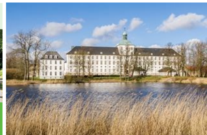
Schloss Gottorf im neuen Schlei-Programm

Foto - Download per hinterlegtem Hyperlink oder über http://www.pressedienst-radreisen.de/press_bilder.html