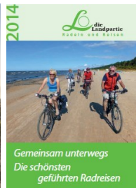
Neue Radreisekataloge 2014