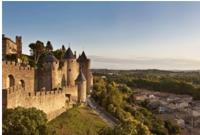
Südfrankreich mit zwei Etappen im Programm