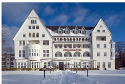
Über Nacht bleiben im himmlischen Strandhotel