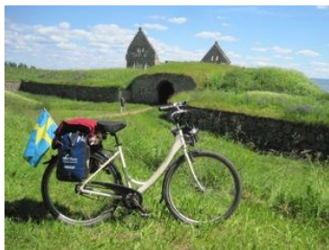
Schweden per Rad entdecken