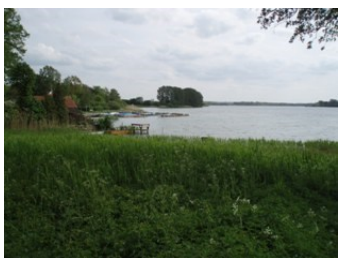
Rast am Passader See