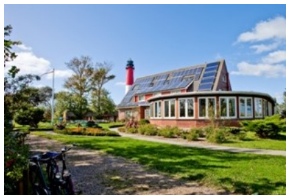
Landhaus Leuchfeuer

Den „schönsten Tag im Leben“ möchten Brautpaare an einem ganz besonderen und romantischen Ort erleben: Die Insel Pellworm, idyllisch in der Insel- und Halligwelt des Nationalparks Schleswig-Holsteinisches Wattenmeer gelegen, stellt dafür die ideale Kulisse dar. Das „Landhaus Leuchfeuer“ am Leuchtturm der Insel bietet verschiedene Hochzeitsmöglichkeiten sowie ein Romantik-Arrangement an. Weitere Informationen, Tarife und Buchungen unter www.leuchfeuer-pellworm.de .