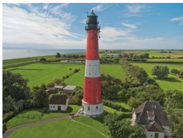
Leuchtturm-Romantik ganz in der Nähe