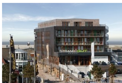
Trendy in SPO: StrandGut Resort