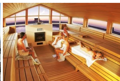
Entspannen in der Pfahlbautensauna