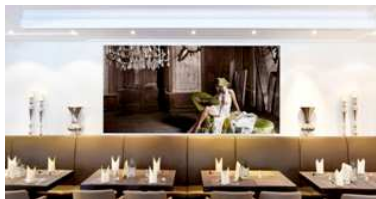
Chillout in der Thomas Lounge