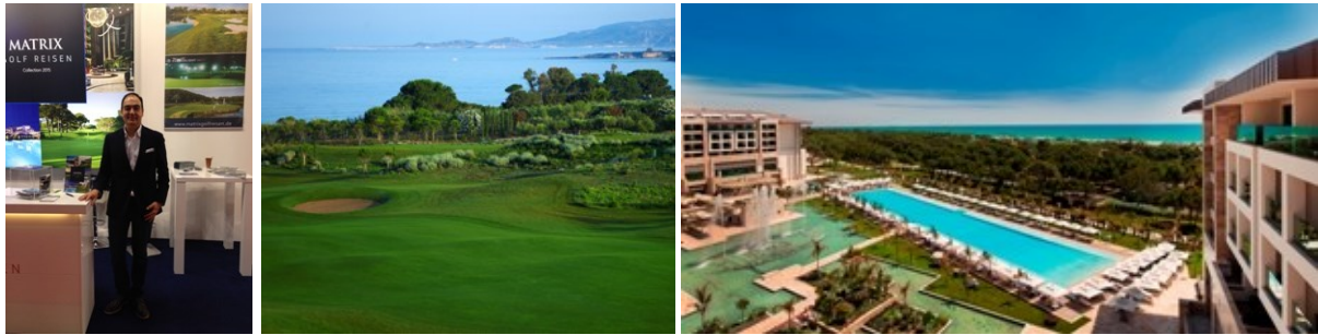
Reiseprofi Uğur Akça kennt die Wünsche der Golfer Golf Club The Dunes Course an der Costa Navarino in Griechenland Das neue Aushängeschild Belek: Das Regnum Carya Golf & Spa Resort

Foto-Download per Hyperlink oder unter http://www.primo-pr.com/bildarchiv/downloads.php?category=58