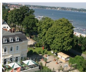
Stilvoll chillen im Mango's

Foto-Download per hinterlegtem Hyperlink oder unter http://www.primo-pr.com/bildarchiv/downloads.php?category=53