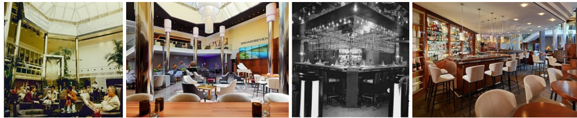
GrandSeven damals und heute