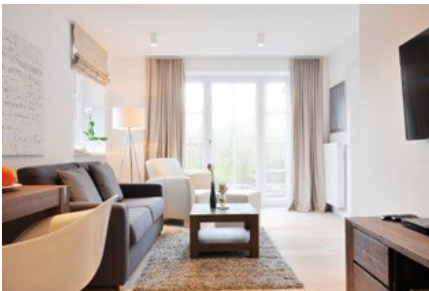
Übernachten mit Stil in der neuen Perlen-Suite