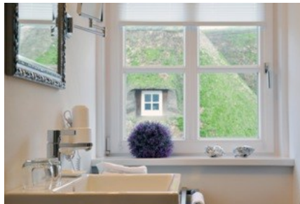
Stylisches Bad in der neuen Muschel-Suite